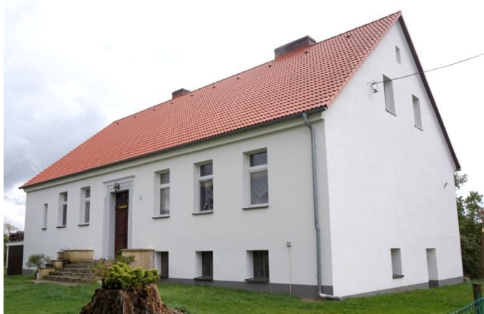
Zdjęcie nr 2. Dwór w zespole, Plac Targowy 5, Bogacica

Budynek dworu został wymurowany na planie prostokąta. Jest on parterowy, z wysokimi piwnicami, nakryty dachem dwuspadowym. Fasada siedmioosiowa z centralnie umieszczonym wejściem z kamiennym obramieniem. W wyniku remontów i przebudów w XX w. elewacje pozbawiono cech stylowych, zachowany został układ wnętrz - dwutraktowy, z sienią na osi. Przy dworze znajdują się zabudowania dawnego folwarku.