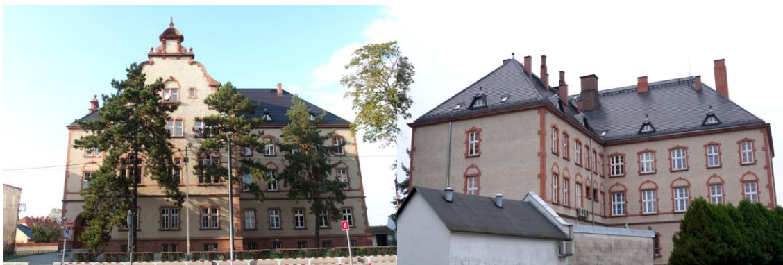
Zdjęcia nr 32, 33. Sąd Rejonowy, ul. Katowicka 2, Kluczbork

zwieńczony trójkątnym naczółkiem, szczyt płd. trójkątny o linii wklęsło - wypukłej, zwieńczony segmentowym naczółkiem zdobionym konchą. Ściany tynkowane fakturalnie, partia cokołowa licowana czerwonym piaskowcem, detal kamienny, ceglany i wypracowany w tynku. Naroża ścian boniowane kamieniem (parter) i cegłą z pojedynczymi kamiennymi boniami (piętra). Okna pojedyncze, zestawione w biforia i triforia, prostokątne, zamknięte odcinkiem łuku (trzecia kond.) oraz z nadświetleniem ukształtowanym schodkowo - w ryzalicie elewacji frontowej. Opaski okien - płaskie, z dolnymi i górnymi uszakami oraz przewiązkami; nad oknami drugiej kondygnacji półokrągłe płyciny nadokienne konturowane ceglanyimi łukami. W elewacji zach. okna drugiej i trzeciej kondygnacji ujęte we wspólne arkadowe blendy o profilowanych węgarach. Partia cokołowa zwieńczona wyładowanym gzymsem, w zwieńczeniu parteru gzymś kordonowy, parapety okien drugiej kondygnacji ujęte płaskim fryzem podokiennym. Drzwi główne prostokątne z półkolistym szklonym nadświetlem, osadzone w szeroko rozglifionym arkadowym portalu ze zwornikime w kluczu profilowanej archiwolty i płytkami, arkadowymi niszami w węgarach.