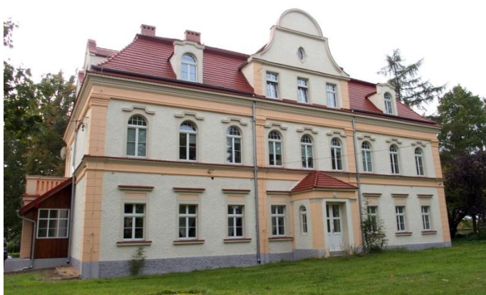
Zdjęcie nr 4. Pałac, nr 1, Bogdańczowice

Zespół usytuowany jest przy jest przy drodze Kluczbork - Gorzów Śl. Zachowała dawna siedziba właścicieli majątku Wuttendorrf, czyli dzisiejszych Bogdańczowic. Obiekt wzniesiony jest w stylu klasycystycznym, zbudowany na przełomie XIX i XX w. Aż do 1945 r. był własnością rodu von Kleinschmidt. Po 1945 r., w pałacu znajdowały się biura miejscowego PGR-u, natomiast w dawnym majątku dworskim Szkoła Rolnicza z Kluczborka urządziła edukacyjne gospodarstwo rolne. Pałac odgradzony ogrodzeniem z murowanymi słupkami.