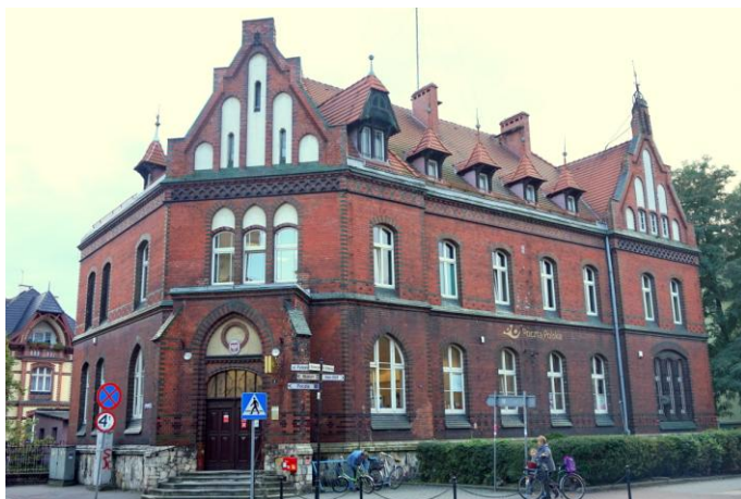
Zdjęcie nr 31. Poczta, ul. Mickiewicza 6, Kluczbork

Długą tradycję posiada poczta w Kluczborku, której neogotycki budynek znajduje się przy ul. Mickiewicza 6.