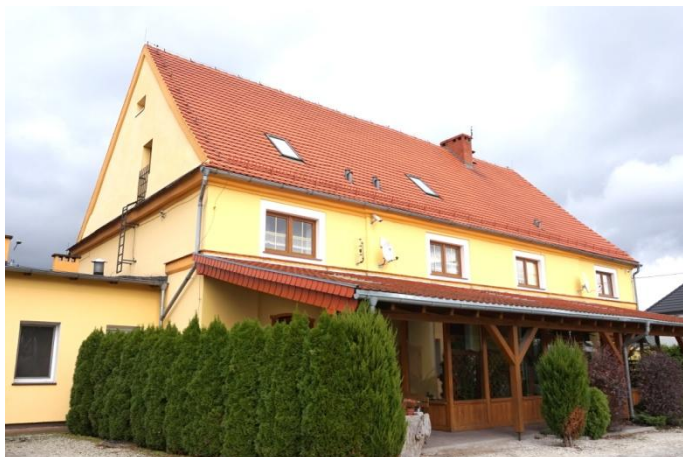
Zdjęcie nr 3. Spichlerz w dawnym zespole folwarcznym, Plac Targowy 2a, Bogacica

Spichlerz wzniesiono w 1 poł. XIX w. Murowany z cegły, otynkowany, prostokątny, dwukondygnacyjny, podpiwniczony, nakryty dachem siodłowym. W ostatnich latach został zmodernizowany podczas adaptacji do funkcji usługowo - mieszkalnych. Między innymi z powodu znacznego powiększenia otworów okiennych, dodania balkonu na elewacji szczytowej oraz daszku pulpitowego budynek utracił swój pierwotny charakter i jest negatywnym przykładem przekształcenia zabytku. Budynek pełni obecnie funkcję usługową.