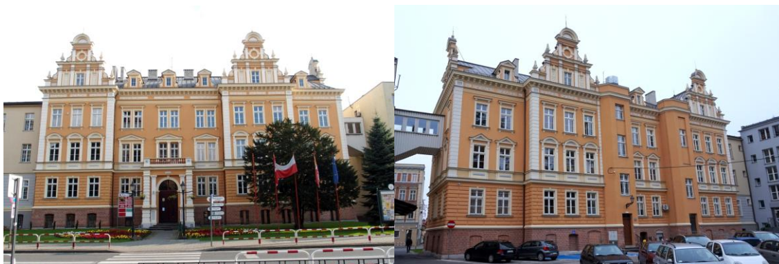
Zdjęcia nr 29, 30. Budynek Starostwa Powiatowego i Urzędu Miejskiego, ul. Katowicka 1, Kluczbork

gzymsami i pilasterkami, narożniki budynku akcentowane pionowymi pasami boniowania, całość zwieńczona wydatnym gzymsem koronującym. Częściowo zachowana drewniana stolarka.