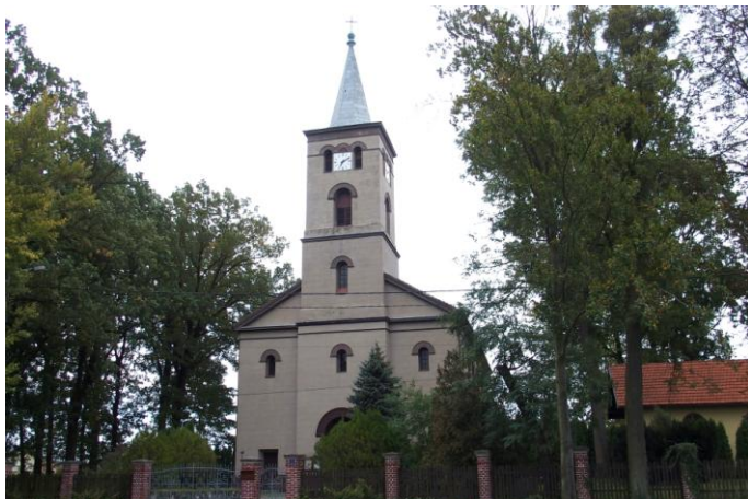
Zdjęcie nr 10. Kościół filialny pw. Świętego Józefa Robotnika, ul. Kozłowska 1, Biadacz

Pierwsza wzmianka o kościele datowana jest na 1541 r. Był to wówczas kościół drewniany, który przetrwał do 1840 r. W 1842 r. staraniem miejscowej ludności, rozpoczęła się budowa nowej, murowanej świątyni. W 1843 r. zakończono budowę kościoła, który początkowo był katolicki, później zaś (do 1945 r.) ewangelicki. Po zakończeniu II wojny światowej wrócił w ręce katolickie. W 2001 r. przeprowadzono remont elewacji całego kościoła.