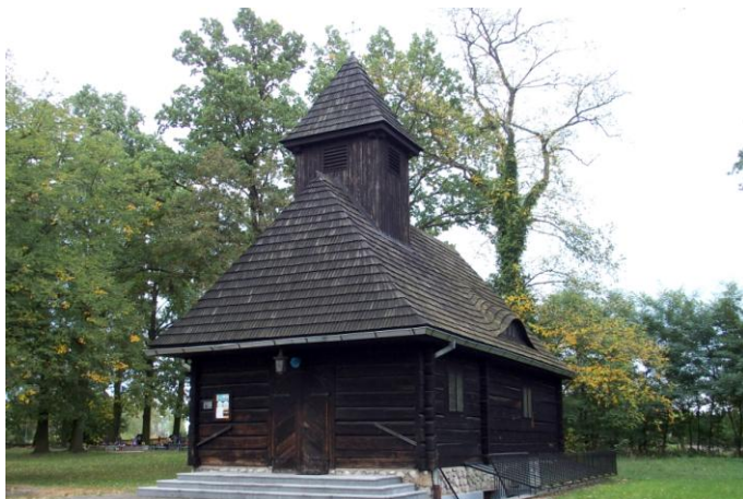
Zdjęcie nr 18. Kaplica cmentarna ewangelicka, ul. Gorzowska, Ligota Górna

Kaplica poewangelicka wybudowana w 1787 r. przez cieślę Jana Kabata, pierwotnie jako cmentarna. Bezpośrednio po II wojnie światowej była niewykorzystywana, dopiero po przejściu jej w 1974 r. przez kościół katolicki, stała się współwłasnością katolickiej i protestanckiej parafii z Kluczborka. Do dnia dzisiejszego odbywają się tu nabożeństwa ekumeniczne z udziałem kapłanów katolickich oraz ewangelickich.