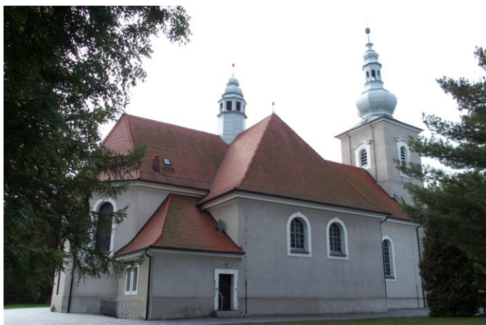
Zdjęcie nr 15. Kościół parafialny pw. św. Stanisława Biskupa i Męczennika, ul. XXX-lecia, Kujakowice Górne

Pierwsze wzmianki o kościele pochodzą z 1318 r. Był to kościół drewniany, który spłonął około 1490 r. Nowy, kamienny został zbudowany w 1494 r. Miał powierzchnię 10 m 2 i drewnianą wieżę. W latach późniejszych kościół był wielokrotnie rozbudowywany i przebudowywany, najstarsze elementy jego konstrukcji liczą sobie ponad 500 lat. Tyle samo ma także najstarszy z kościelnych dzwonów. W 1917 r. zostały zdjęte 2 dzwony z wieży kościelnej i przetopione na łuski amunicji w I wojnie światowej. Po raz drugi w 1942 r. zdjęte zostały 3 dzwony z wieży kościelnej. Dwóch dzwonów nie udało się uratować. Tym bardziej