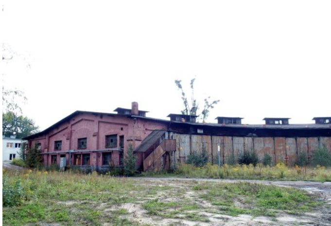
Zdjęcie nr 34. Budynek lokomotywowni wachlarzowej, ul. Sikorskiego, Kluczbork

Z licznych na terenie miasta budynków poprzemysłowych oraz związanych z kolejnictwem warto wymienić budynek parowozowni z warsztatami przy Alei Kolejowej oraz wpisane do rejestru zabytków - dziewiętnastowieczny budynek lokomotywowni wachlarzowej wraz z obrotnicą w zespole stacji kolejowej przy ul. Sikorskiego i budynek administracyjny młyna handlowego z 1907 r. przy ul. Młyńskiej 8.