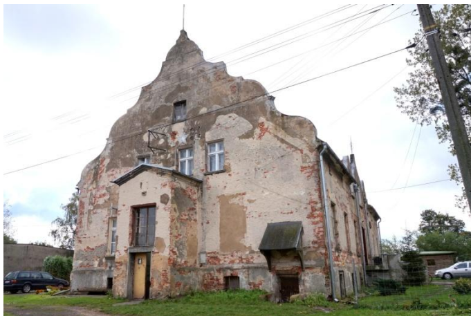
Zdjęcie nr 7, Pałac, ul. Mostowa 3, Smardy Górne

Niewielki neorenesansowy dwór wzniesiono prawdopodobnie w 2 poł. XIX w., być może w miejscu wcześniejszej rezydencji. Dwór był siedzibą właścicieli, a następnie dzierżawców majątku Smardy Górne (Smardy V). Po II wojnie światowej obiekt wykorzystywano jako wielorodzinny budynek mieszkalny. Wolnostojący budynek na rzucie prostokąta, wysoko podpiwniczony, jednokondygnacyjny z użytkowym poddaszem zaznaczonym kondygnacją małych okienek, nakryty wysokim dwuspadowym dachem ujętym-w trójkątne kotarowe szczyty o wklęsło - wypukłej krawędzi. W elewacji tylnej i bocznej - parterowe aneksy. Na osi elewacji frontowej - pseudoryzalit zwieńczony facjatką, flankowaną przez dwie lukarny; szczyty lukarn i facjatki o wykroju wklęsło - wypukłym. Ściany tynkowane, bez podziałów, w zwieńczeniu - profilowany gzyms. Okna prostokątne. Dach kryty ceramiczną dachówką. Obecnie w dalszym ciągu dawny dwór pełni funkcję mieszkalną. Przy budynku znajdują się zabudowania folwarczne - obora i stajnia oraz młyn gospodarczy.