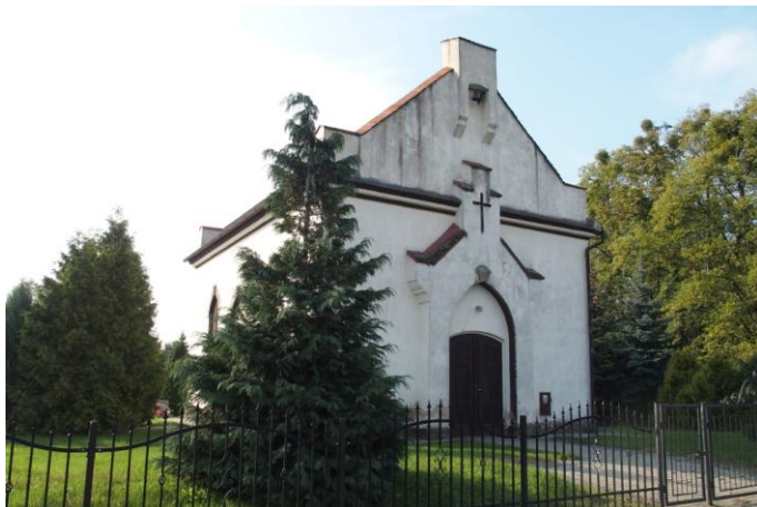
Zdjęcie nr 17. Kaplica cmentarna, ul. Wołczyńska 69, Ligota Dolna

Pierwsza wzmianka o kaplicy cmentarnej pochodzi z 1802 r., obecna natomiast powstała w 1900 r. Została wybudowana w stylu neogotyckim, o czym świadczą widoczne również na zewnątrz okna. Wnętrze kaplicy jest bardzo skromne. Na wyposażenie jej składa się między innymi ambona, krzyż z figurą Jezusa. Na belkach umieszczono cytaty w języku niemieckim z Pisma Świętego.