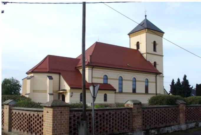
Zdjęcie nr 19. Kościół parafialny pw. Nawiedzenia MB, ul. Księdza Rigola, Łowkowice

Pierwsze informacje o parafii pochodzą z 1253 r., którą założyli Krzyżowcy z Czerwona Gwiazdą z Wrocławia. Oni też prowadzili parafię i duszpasterstwo do 1810 r. W czasie przemian reformacyjnych, parafia w Łowkowicach należała do katolików.