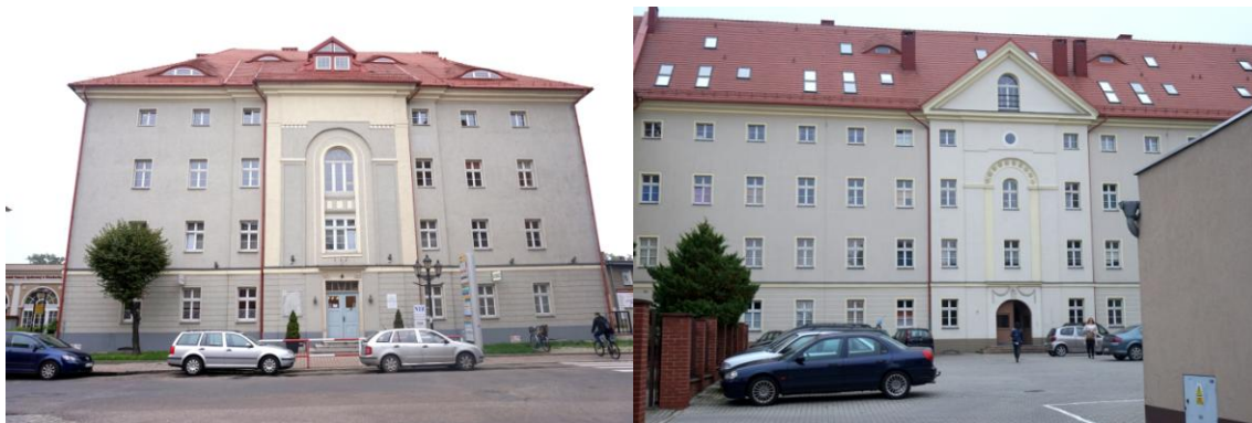
Zdjęcia nr 27, 28. Dawny zakład dla ubogich, ul. Zamkowa 6-Podwale 4a- 4b, Kluczbork

Charakterystycznym dla Kluczborka obiektem jest dawny zakład dla ubogich , przy ul. Zamkowej 6-Podwale 4a-4b, obecnie budynek mieszkalno - usługowy. Wybudowany w 1778 r. w projekcie Karola Gottharda Langhansa. Na miejsce budowy wybrano wówczas plac, na którym wcześniej stał spalony w 1736/1737 r., budynek Komandorii krzyżowców z czerwoną gwiazdą. 23 maja 1779 r. otwarto krajowy Zakład dla Ubogich - mogący pomieścić 500 biednych, inwalidów wojennych, bezdomnych i żebraków. Od 1804 r. czynny był szpital. Po pożarze głównego budynku w 1819 r., zakład został odbudowany z pewnymi zmianami i uproszczeniami architektonicznymi w latach 1820 - 1823. Przejęty następnie przez prowincję śląską, w 1874 r. został przekształcony w szpital dla umysłowo chorych, który był czynny do likwidacji przez władze hitlerowskie w 1936 r. 14 grudnia 1939 r. utworzono tu pierwszy na terenie śląskiego okręgu wojskowego jeniecki obóz oficerski pod nazwą Oflag VIII A Kreuzburg, a wiosną 1943 r. - obóz dla internowanych obywateli państw wrogich III Rzeszy, tzw. Ilag VIII/Z. Kilka razy przebudowywany, po wojnie internat, magazyn.