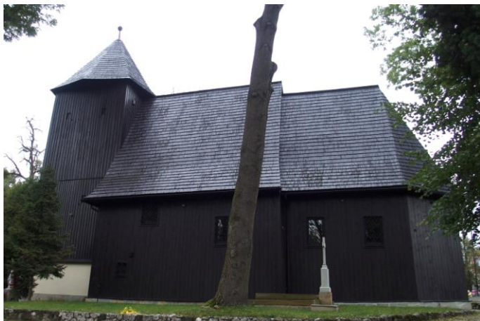
Zdjęcie nr 9. Kościół parafialny pw. Wniebowzięcia NMP, ul. Braci Bassy, Bąków

Jest to najstarszy drewniany kościół przedreformacyjny na terenie gminy Kluczbork, wybudowany na przełomie XV/XVI w. Orientowany. Około 1550 r. przejęty przez ewangelików i użytkowany przez nich do 1945 r. Obecnie katolicki.