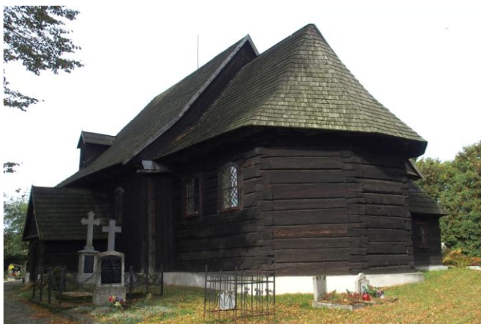
Zdjęcie nr 20. Kościół ewangelicki, nr 35, Maciejów