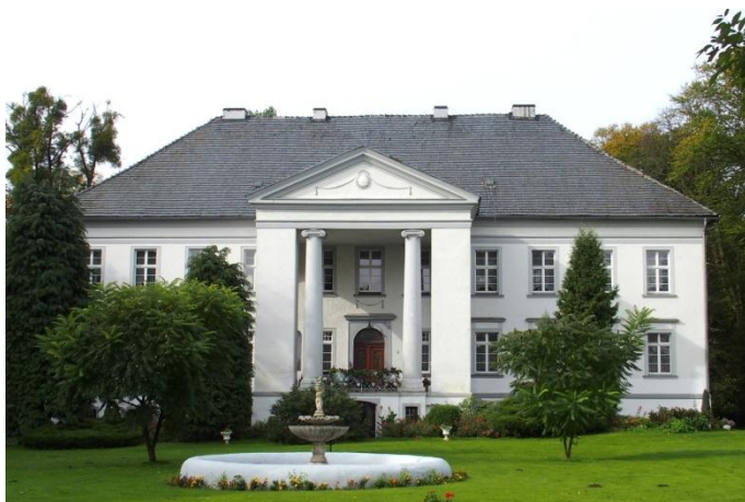
Zdjęcie nr 5, Pałac, nr 43, Maciejów

Pałac wzniesiony w ok. 1790 r. w stylu klasycystycznym, obecnie stanowi własność prywatną. Zaprojektowany przez Carla Gottharda Langhans (twórca Bramy Brandenburskiej). Zwrócony frontem na północny - wschód. Murowany z cegieł, otynkowany, piętrowy i wysoko podpiwniczony. Wzniesiony na rzucie prostokąta z wysuniętym portykiem i podjazdem na osi elewacji frontowej. Nad wejściem do piwnic podjazd i portyk o dwóch kolumnach jońskich, połączonych ażurową balustradą żelazną. Po bokach wysokie arkady, półkoliście zamknięte. Wejście również zamknięte półkoliście, nad nim feston stiukowy. Okna posiadają proste obramowania, a w przyziemiu gzymsiki wsparte na wolutach. Od strony parku elewacja z zaakcentowaną częścią środkową, zwieńczona trójkątnym, spłaszczonym przyczółkiem. W elewacjach bocznych dekoracja stiukowa festonami. Czterospadowy dach, kryty dachówką.