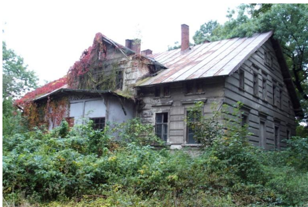
Zdjęcie nr 8. Dwór, nr 2-4, Wrzosey