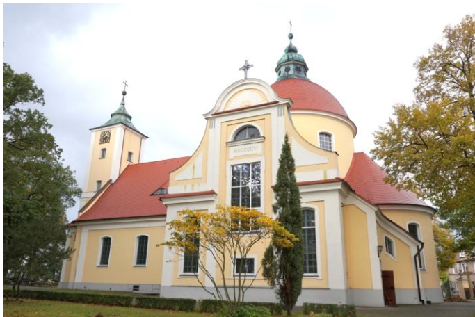
Zdjęcie nr 11. Kościół parafialny pw. św. Trójcy, ul. Wolności, Bogacica