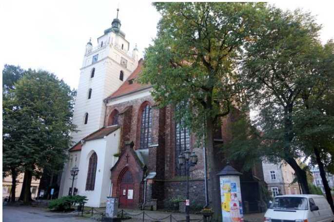
Zdjęcie nr 12. Kościół ewangelicki pw. Chrystusa Zbawiciela, Plac Gdacjusza, Kluczbork

Gotycki kościół został zbudowany w XIV w. na miejscu poprzedniego, pochodzącego z 1298 r. Wybudowana wówczas świątynia składała się z XIII-wiecznego prezbiterium (wykonana we wczesnogotyckim stylu) oraz z XIV-wiecznej wieży. W wyniku częstych pożarów kościół był wielokrotnie odbudowywany, przez co zmieniał swój wygląd. Od 1527 r. jest świątynią ewangelicką. Pożar z 1737 r. spowodował całkowite zniszczenie świątyni, ratusza i budynków mieszkalnych. Odbudowano wieżę, a także nawę boczną (w części zachodniej kościoła). Drewniany strop zastąpiono sklepieniem. Nawa główna - w głębi prezbiterium.