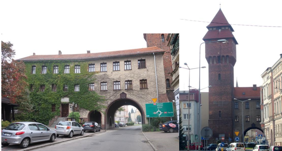
Zdjęcia nr 21, 22. Muzeum im. Jana Dzierżona i wieża baszta bramna, ul Zamkowa 10