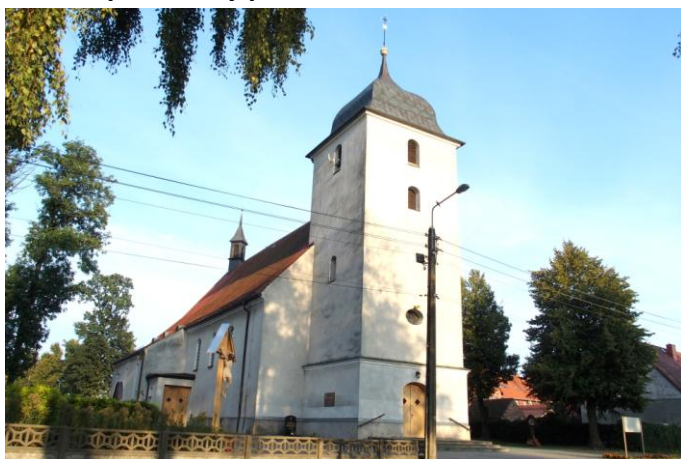
Zdjęcie nr 16. Kościół parafialny pw. św. Jana Chrzciciela, Kuniów

Pierwsza wzmianka o kościele parafialnym datowana jest na 1301 r. Kościół ten należał do Krzyżowców z czerwoną gwiazdą i był duszpastersko przez nich obsługiwany aż do czasów sekularyzacji, czyli do 1810 r. Miał wymiary 15 m x 7,5 m, posiadał przybudowaną drewnianą wieżę na dzwony, a na dachu kościoła znajdowała się wieżyczka na sygnaturkę. Kościół został zburzony, a na jego miejscu postawiono w latach 1799 - 1801 nowy, masywny i murowany. W 1818 r. wybudowano plebanię, użytkowaną do dnia dzisiejszego. W 1932 r. kościół został rozbudowany. Poświęcenie wyremontowanego kościoła nastąpiło 23 maja 1932 r. W grudniu 1934 r. zostały zamontowane nowe organy, w 1935 r. został ozdobiony prospekt organowy. Następny gruntowny remont kościoła, wraz z jego malowaniem, odnowieniem ołtarzy, gruntownym remontem organów został przeprowadzony w latach 1993 - 1995. Całkowicie wymieniono wtedy dachówkę na dachu kościoła, założono miedziane rynny, opierzenia a wieżę i wieżyczkę pokryto blachą miedzianą.