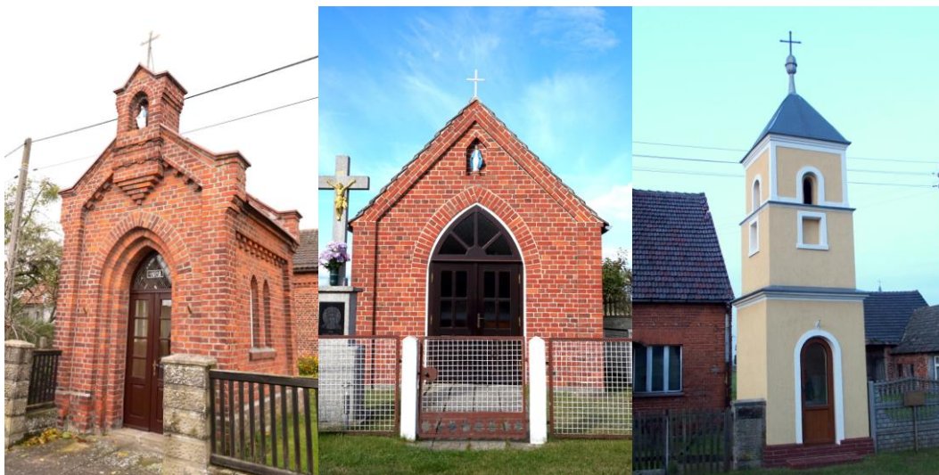
Zdjęcia nr 36, 37, 38. Kapliczka, ul. Wiejska przy 16, kapliczka; kapliczka, Bogacka Szklarnia przy nr 24; kapliczka, ul. Wiejska przy nr 21, Borkowice

Kapliczki przybierają też formę słupową. Częstym elementem pejzażu wiejskiego są kamienne lub drewniane krzyże, często w sąsiedztwie kaplic, czasem usytuowane samodzielnie.