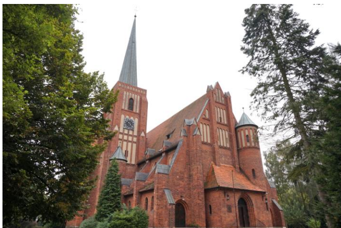
Zdjęcie nr 13. Kościół parafialny pw. MB Wspomożenia Wiernych, ul. Skłodowskiej - Curie, Kluczbork

Najstarszą świątynią w historii Kluczborka był zbudowany w średniowieczu drewniany kościółek pw. św. Trójcy. Zbudowano go poza murami miasta na tzw. Przedmieściu Polskim. W 1558 r. został przejęty przez protestantów, a w 1708 r. wrócił w ręce katolików.