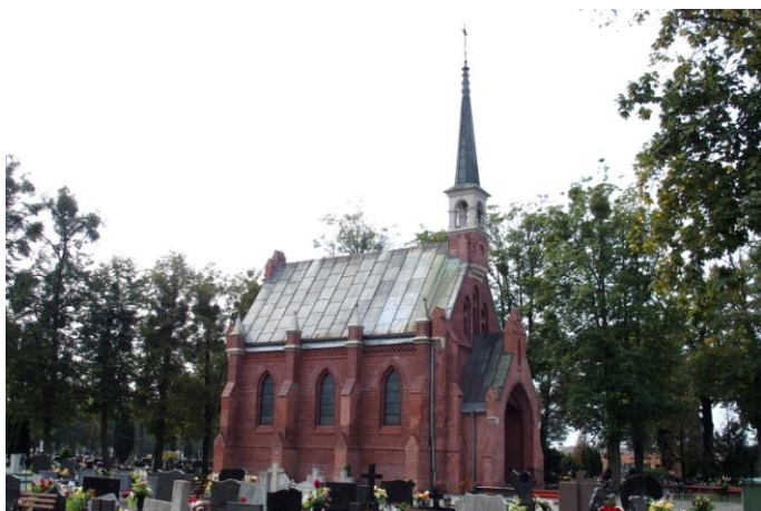
Zdjęcie nr 14. Kaplica cmentarna, ul. Opolska, Kluczbork