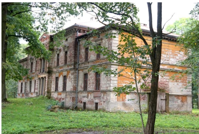
Zdjęcie nr 6. Pałac, ul. Polna 9, Smardy Dolne

Pałac powstał w XIX w. Neoklasycystyczny, murowany z cegły, tynkowany, wzniesiony na planie prostokąta, podpiwniczony, dwukondygnacyjny, nakryty dachami o niewielkim spadku. Pałac składa się z wyższej części środkowej i dwóch niższych skrzydeł po bokach. Dziewięcioosiowa fasada z centralnym ryzalitem, portykiem i loggią na piętrze, zwieńczona jest trójkątnym naczółkiem. Elewacje zdobione boniowaniem. Układ wewnątrz dwutraktowy z sienią na osi oraz salą balową oraz salą bankietową na parterze. Do pałacu przylega park krajobrazowy o powierzchni 5,5 ha z licznie zachowanym starodrzewiem, przy budynku znajduje się staw obsadzony dębami.