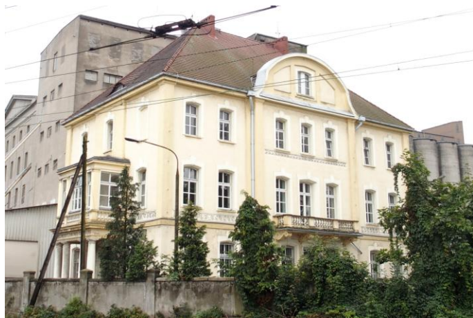
Zdjęcie nr 35. Budynek administracyjny w zespole młyna, ul. Młyńska 8, Kluczbork

podokienną ozdobioną tralkami. Elewacja pn. jest siedmioosiowa. Jej środkowa, trójosiowa część jest delikatnie zryzalitowana, zwieńczona szczytem o linii falistej i ze skromnym barokowym wystrojem. Osiowość elewacji została dodatkowo podkreślona przez balkon z tralkową balustradą, oparty na wydatnych, wolutowych wspornikach 8 .