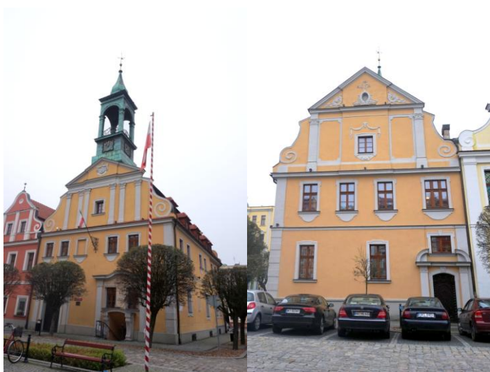
Zdjęcia nr 23, 24. Ratusz, ul. Rynek 1, Kluczbork

Obecnie budynek jest siedzibą kilku instytucji, między innymi Urzędu Stanu Cywilnego.