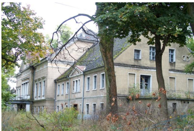
Zdjęcie nr 1. Pałac, ul. Braci Bassy 18-20-22, Bąków

Pałac w Bąkowie wybudowany w 1 poł. XIX w., częściowo zmodernizowany. Środkowe skrzydło z niewielkim ryzalitem poprzedzonym kolumnowym portykiem i zwieńczonym trójkątnym naczółkiem. Skrzydła boczne parterowe, siedmioosiowe. Wnętrze głównego skrzydła zmodernizowane, w skrzydłach bocznych zachowany detal architektoniczny. Na tyłach pałacu rozciąga się rozległy park krajobrazowy z XIX w., ukształtowany w stylu angielskim. Zespół tworzy także rozległy folwark, w skład którego wchodzi m.in. budynki gorzelnii, suszarnia lnu, stodoły, spichlerz, obory, domy mieszkalne dla zarządcy, pracowników folwarcznych. Pałac wymaga przeprowadzenia prac konserwatorskich. Zniszczeniu uległy m.in. elementy dekoracyjne (drewniany fryz kostkowy na elewacji, obramienia okien), tynki zewnętrzne, wnętrza mieszkalne bocznych skrzydeł pałacu. Zaniedbane i porośnięte roślinnością są schody i taras przy tylnej elewacji.