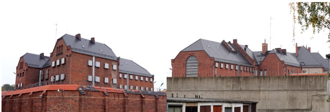
Zdjęcia nr 25, 26. Więzienie, ul. Katowicka 4, Kluczbork

Elewacja wschodnia jest w formie podobna do elewacji zachodniej lecz zamknięta ryzalitem 4-osiowym. Elewacja północna (szczytowa) jest symetryczna, 1-osiowa 7 .